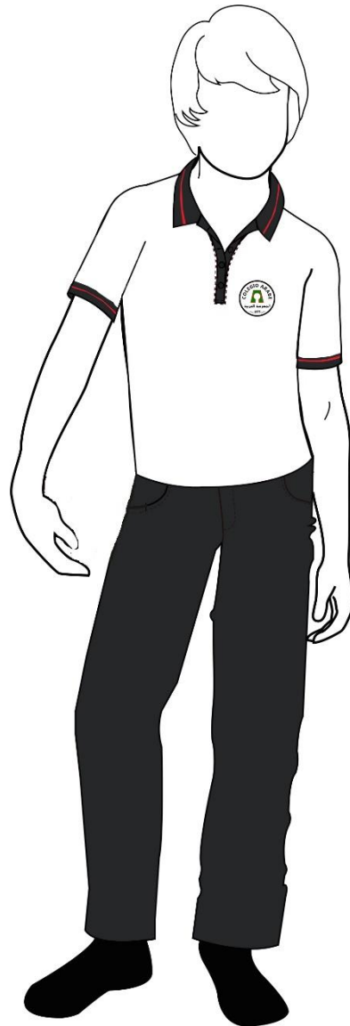
Imagen 2 Alumnos

Se debe considerar polera manga larga, respetando el diseño indicado, a lo menos hasta la talla 12.