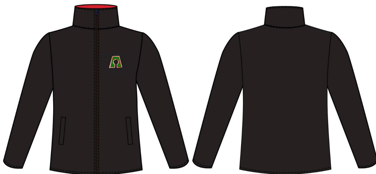
Imagen 3 Alumnas/Alumnos

Para todo el alumnado, de enseñanza Básica y Media, se considera la misma chaqueta, color negro, interior del cuello color rojo, con bolsillos a ambos lados, logo de colegio bordado (no insignia), los cierres deben ser superior o igual a la calidad de la marca YKK, botones deben ser resistente 100% acrílico, la tela debe ser softshell teñido liso y anti pilling un lado, 100% poliéster, tejido de punto, hilado 150D/96F, espesor aproximado 4.2mm.